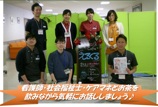
看護師・社会福祉士・ケアマネとお茶を飲みながら気軽にお話ししましょう♪

認知症の人とその家族を支援する事を目的に国が施策の一つとして位置づけている取り組みです。 認知症カフェは“誰でも”参加でき、お茶を飲みながら認知症の人や家族の悩みを共有したり、日頃の疑問や不安を専門職に相談したり出来る場所です。 今回は飲み物とお菓子代として参加費100円をいただきましたが、施設への勧誘等は一切いたしませんので、安心して遊びにきてください。