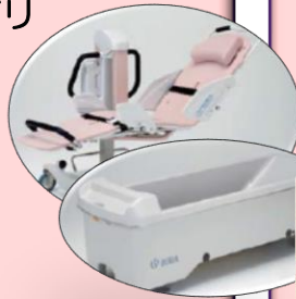
又は機械浴での安全な入浴♨