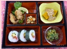
2月4日の行事食 【恵方巻ご膳】