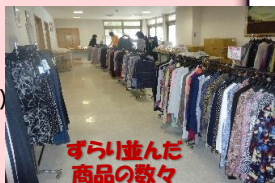
3月行事の衣料品販売会↑