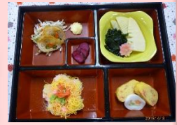
4月8日の行事食 【お花見ご膳】