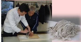
3月6日の行事食 【手打ち蕎麦の実演】