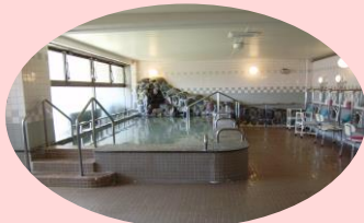
温泉気分でゆったり入浴♪