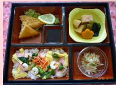
3月1日の行事食 【ひな祭ちらしご膳】